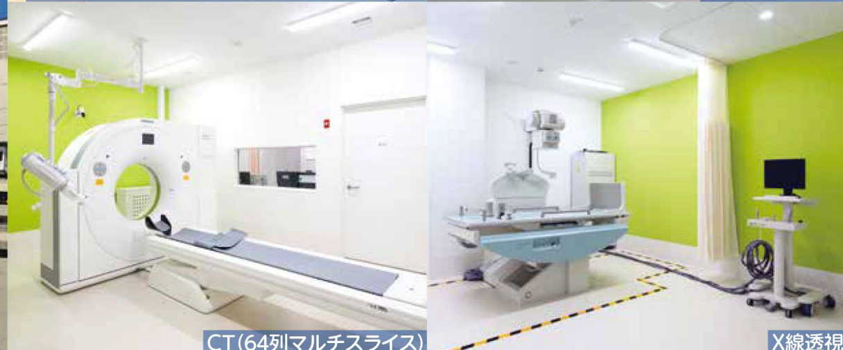
CT(64列マルチスライス)