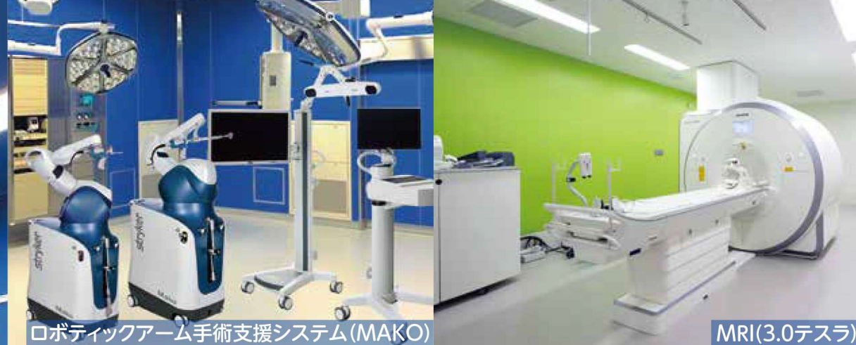
ロボティックアーム手術支援システム(MAKO)