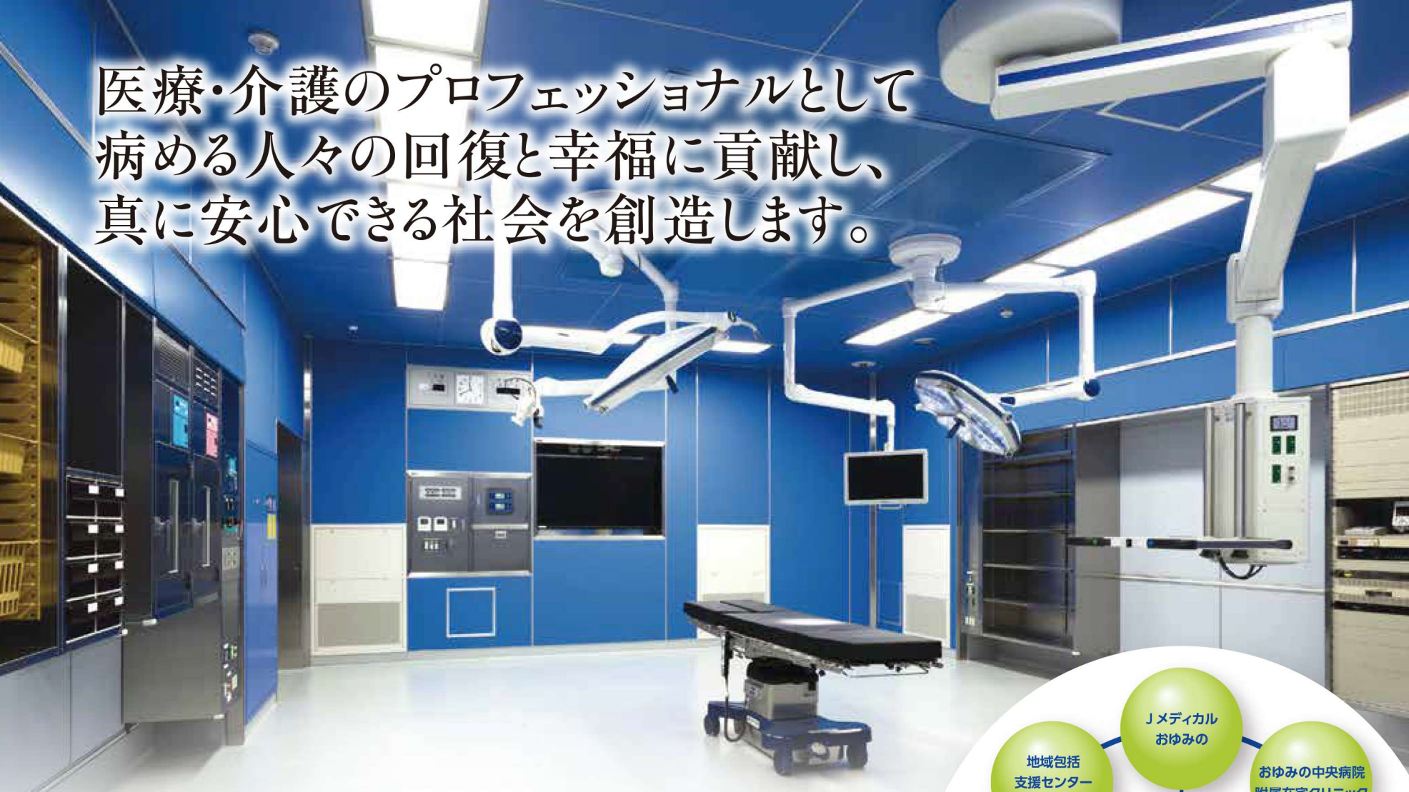
第1手術室 最新のバイオクリーンルームを完備 ※米国連邦規格FED.St209B規格 クラス100

医療・介護のプロフェッショナルとして 病める人々の回復と幸福に貢献し、 真に安心できる社会を創造します。